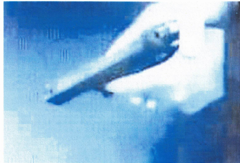
Der Banküberfall wurde von ServusTV nachgestellt (Foto links). Die Original-Pistole (siehe oben) bleibt verschwunden. Der Täter trug eine blaue Mütze und weiße Handschuhe