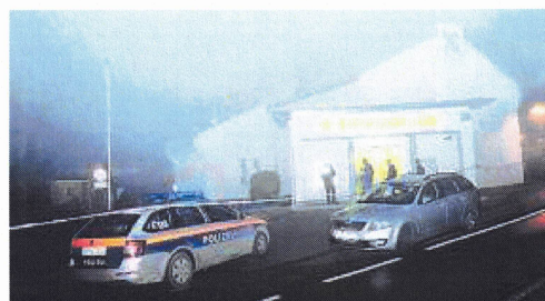
Tatortarbeit nach dem Überfall in Schiefling/See

Ein Jahr später wurde der Filialleiter der Bank wieder Opfer eines Überfalls: Er wurde im hinteren Bereich der Bank von zwei Männern mit einer Waffe brutal niedergeschlagen. Dann zwangen sie ihn, den Tresor zu öffnen. Dieser Banküberfall ist mittlerweile geklärt.